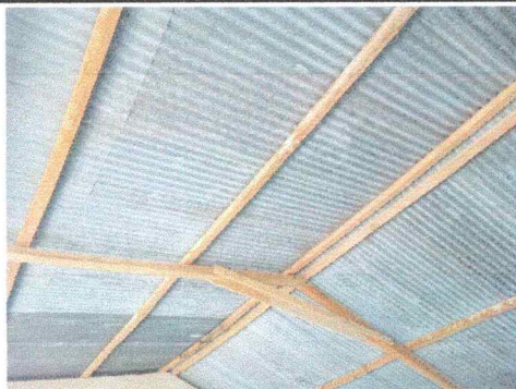
Foto1: Se observa el deterioro de las costaneras y las tijeras.